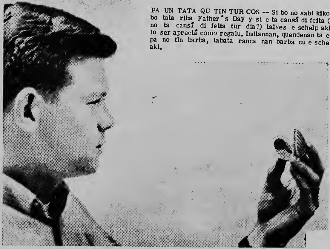
PA UN TATA QU TIN TUR COS -- Si bo no sabi kiko duna bo tata riba Father's Day y si e ta cansa di feita (y ken no ta cansa di feita tur dia?) talves e schelp aki riba lo ser aprecia como regalo. Indiannan, quendenan ta conoci pa no tin barba, tabata ranca nan barba cu e schelpnan aki.

Fuentenan digno di credito a bisa cu e rebelde nan a ataca e ciudad Bandera ya largu un planta central electrica for di accion,